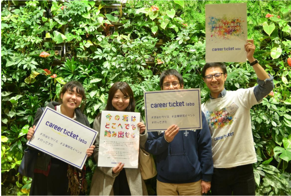
＜イベント終了後、運営スタッフとのフリータイムの様子＞