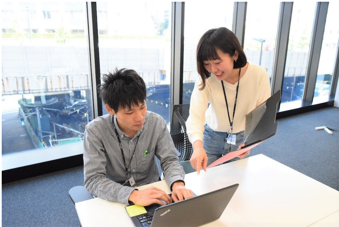
(左)現在働かれているユーザー、(右)ケアスタッフ

レバレッジズは障がい者の雇用促進を目的とする就労支援サービス「ワークリア」を4月1日から開始しました。4月施行の改正障がい者雇用促進法で企業の障がい者法定雇用率が2.2%に引き上げられ、精神障がい者の雇用も義務つけられたことに対応。若年層向け就労支援サービス「ハタラクティブ」のノウハウを活用するほか障がい者をまずレバレッジズが直接雇用し、就業訓練後に企業に紹介します。