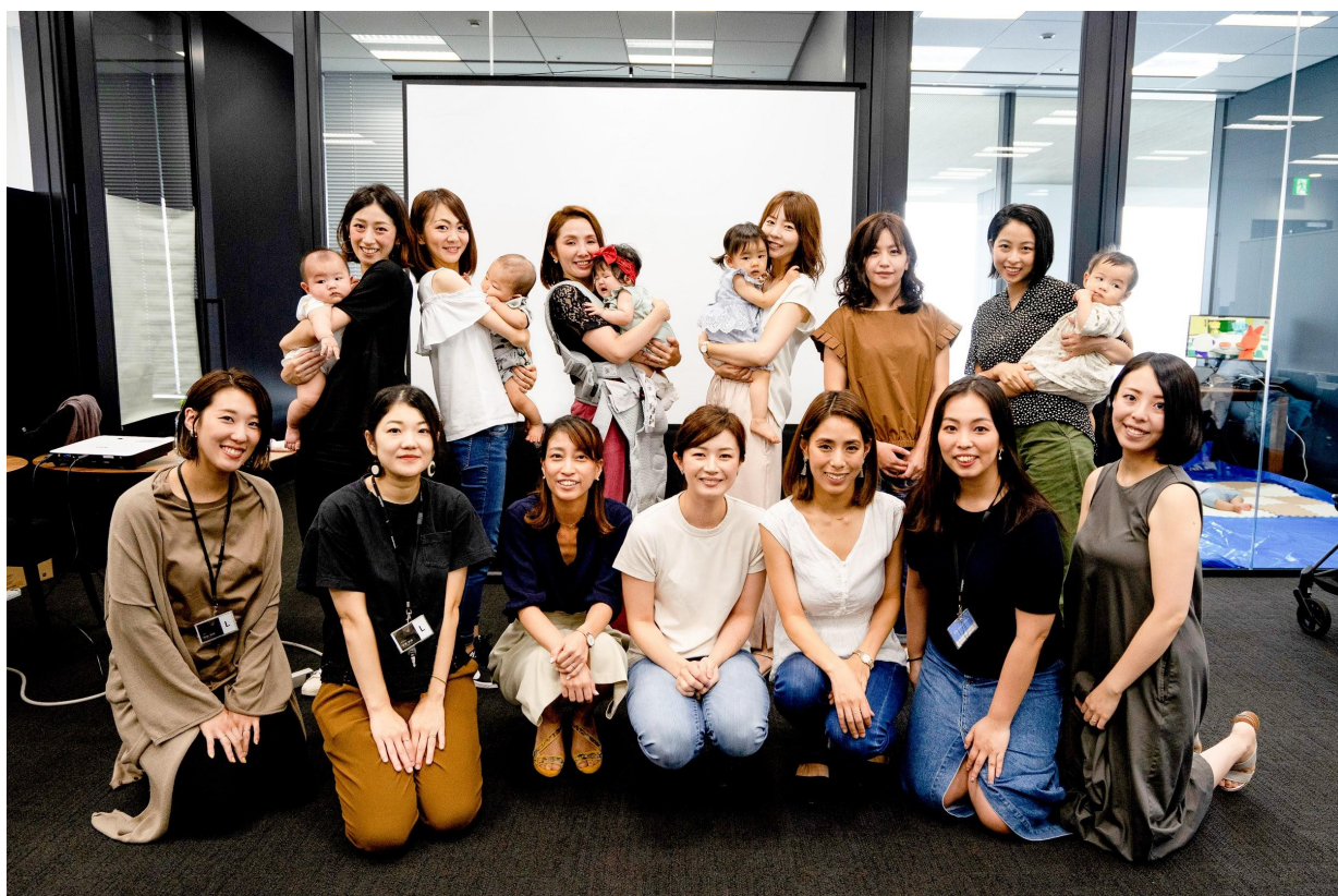
2019年に開催された育休中社員向けの復職前セミナーの様子 (現在は新型コロナウイルス感染拡大防止のため、一時中止しています。)

レバレッジズ株式会社は、Great Place To Work® Institute Japan(以下:GPTWジャパン)が実施した2022年「働きがいのある会社」ランキングにて女性ランキングベストカンパニー、1位を受賞しました。